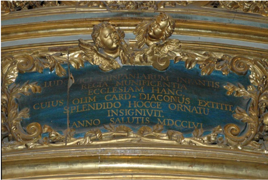
Figure 3. Church of Santa Maria della Scala, inscription on organ loft (photo D.R. Marshall, 2004).