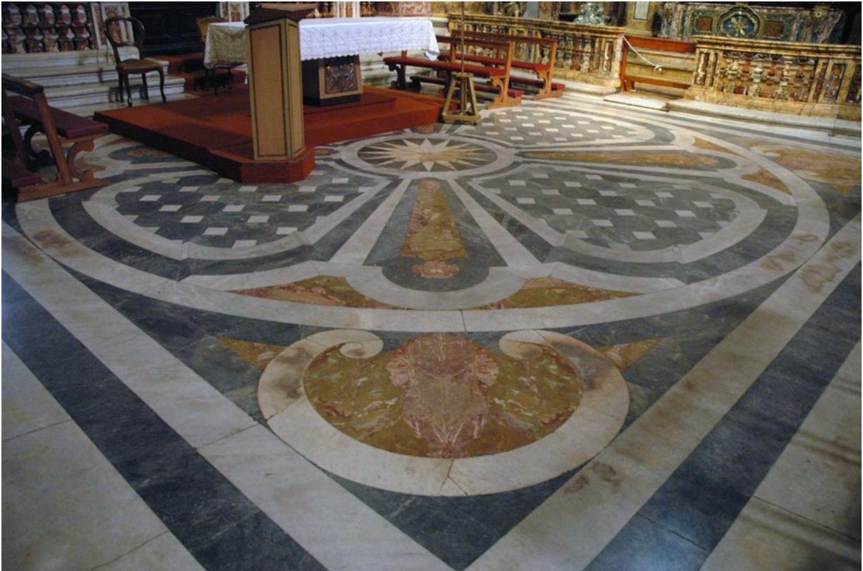
Figure 7. Church of Santa Maria della Scala, floor paving beneath the choir. Design by Giovanni Paolo Panini, execution by Camillo Zaccaria.