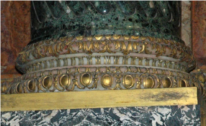
Figure 6. Santa Teresa Chapel, detail of column bases.

Meanwhile, on 9-10 May 1737 the two fluted columns of verde antico with white marble bases adorned with gilded copper (fig. 6) were placed on the right side of the altar, and work was proceeding with capitals. It was hoped that the other two would be installed by the time of the feast of Saint Teresa (15 October) (doc. 9); and indeed they were finished and installed by the end of September, in time for the fešta (doc. 10). The feast of Saint Teresa was particularly important in that year, as it was paid for by Cardinal Acquaviva, who employed Ferdinando Fuga to design the decorations 32 . As part of his project to decorate the church, Fuga had the centring – evidently that for the series of arches above the columns of the chapel – taken down, to be re-erected afterwards. A large canvas and damask fabrics covered the columns and marble, allowing for a passage for the priests to pass along in order to officiate at mass.