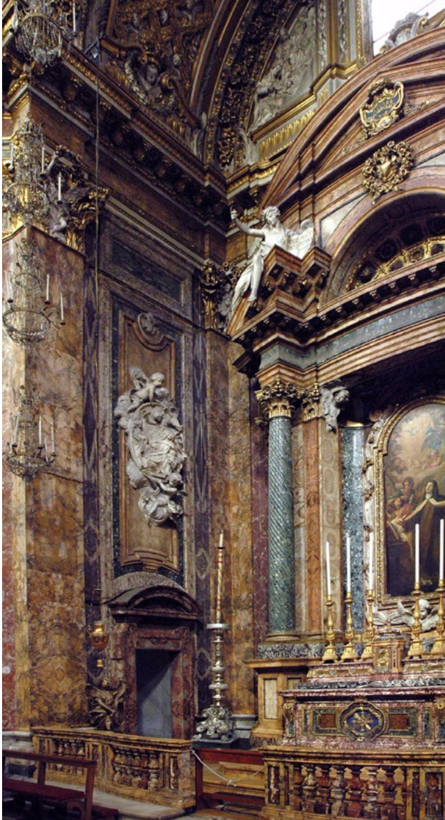
Figure 5. Chapel of Santa Teresa, detail showing left side.