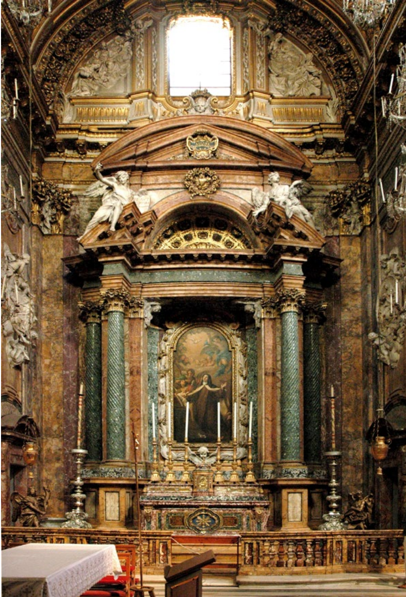
Figure 1. Rome. Church of Santa Maria della Scala, Chapel of Santa Teresa by Giovanni Paolo Panini.