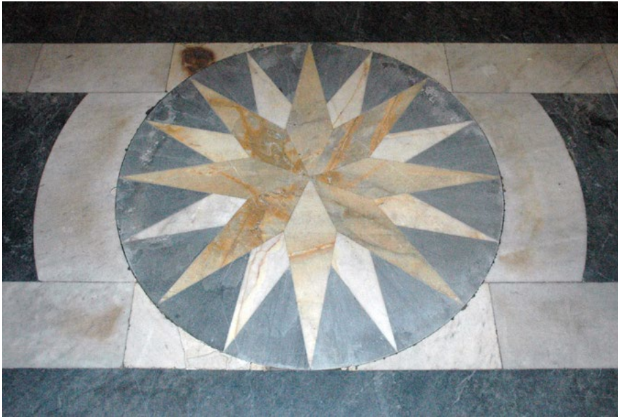
Figure 8. Church of Santa Maria della Scala, common grave.

sum was also a gift from an individual, and it was not known whether he was a religious or secular. Payments for work on the paving run from 17 October 1737 until after 9 April 1739. These include payments to «Maestro Antonio Giubanelli, detto il Prefetto», for 35 scudi for two new «sepulture», which, as the Memorie makes clear, were two new common graves, 10 palmi square, located at the ends of each line of tomb slabs near the entrance door (fig. 8).