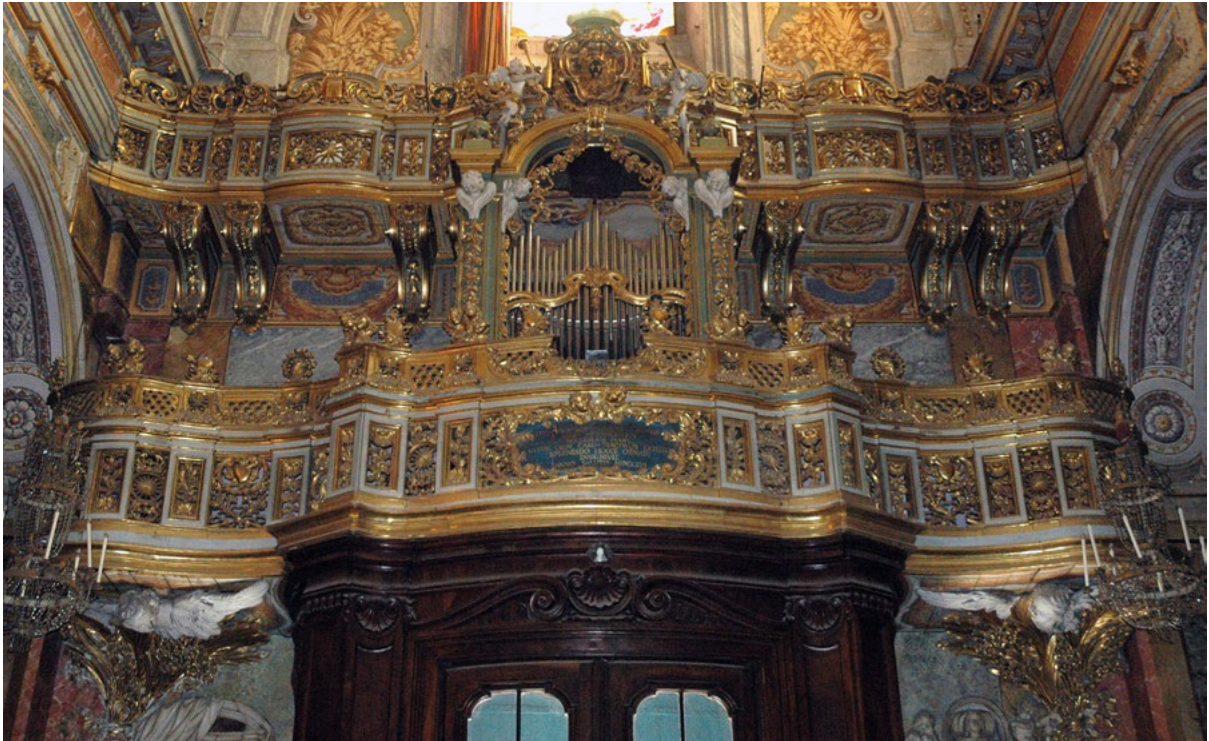
Figure 11. Church of Santa Maria della Scala, cantoria and bussola by Giuseppe Panini.