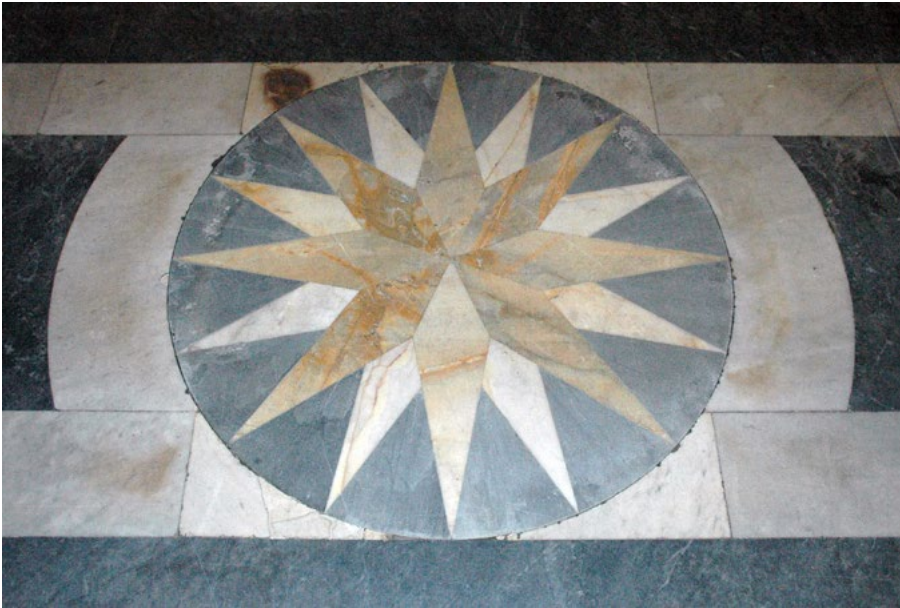
Figure 8. Church of Santa Maria della Scala, common grave.