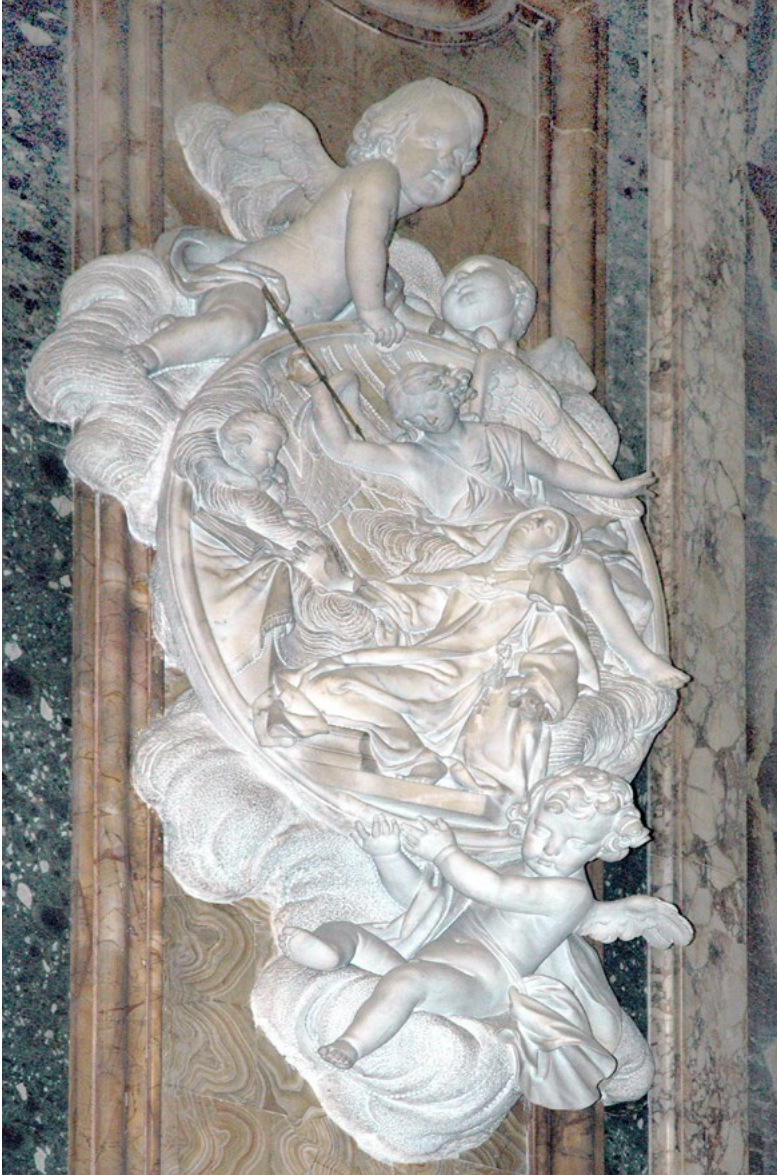
Figure 10. Michel-Ange Slodtz, Transverberation of Santa Teresa, 1638, bas-relief. Rome, Santa Maria della Scala.