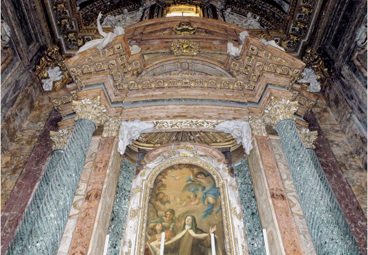
Figure 12. Chapel of Santa Teresa, Detail showing gilded rays above the altarpiece.