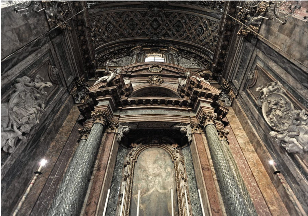
Figure 2. Chapel of Santa Teresa, detail showing central pediment.