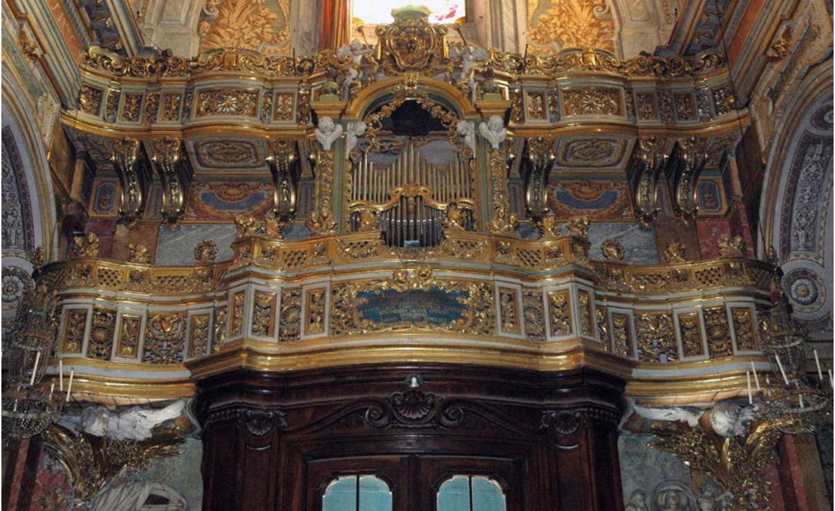
Figure 11. Church of Santa Maria della Scala, cantoria and bussola by Giuseppe Panini.