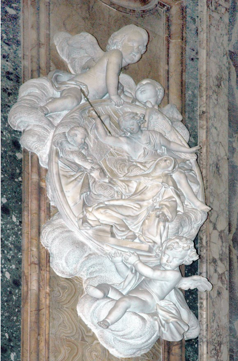
Figure 10. Michel-Ange Slodtz, Transverberation of Santa Teresa, 1638, bas-relief. Rome, Santa Maria della Scala.