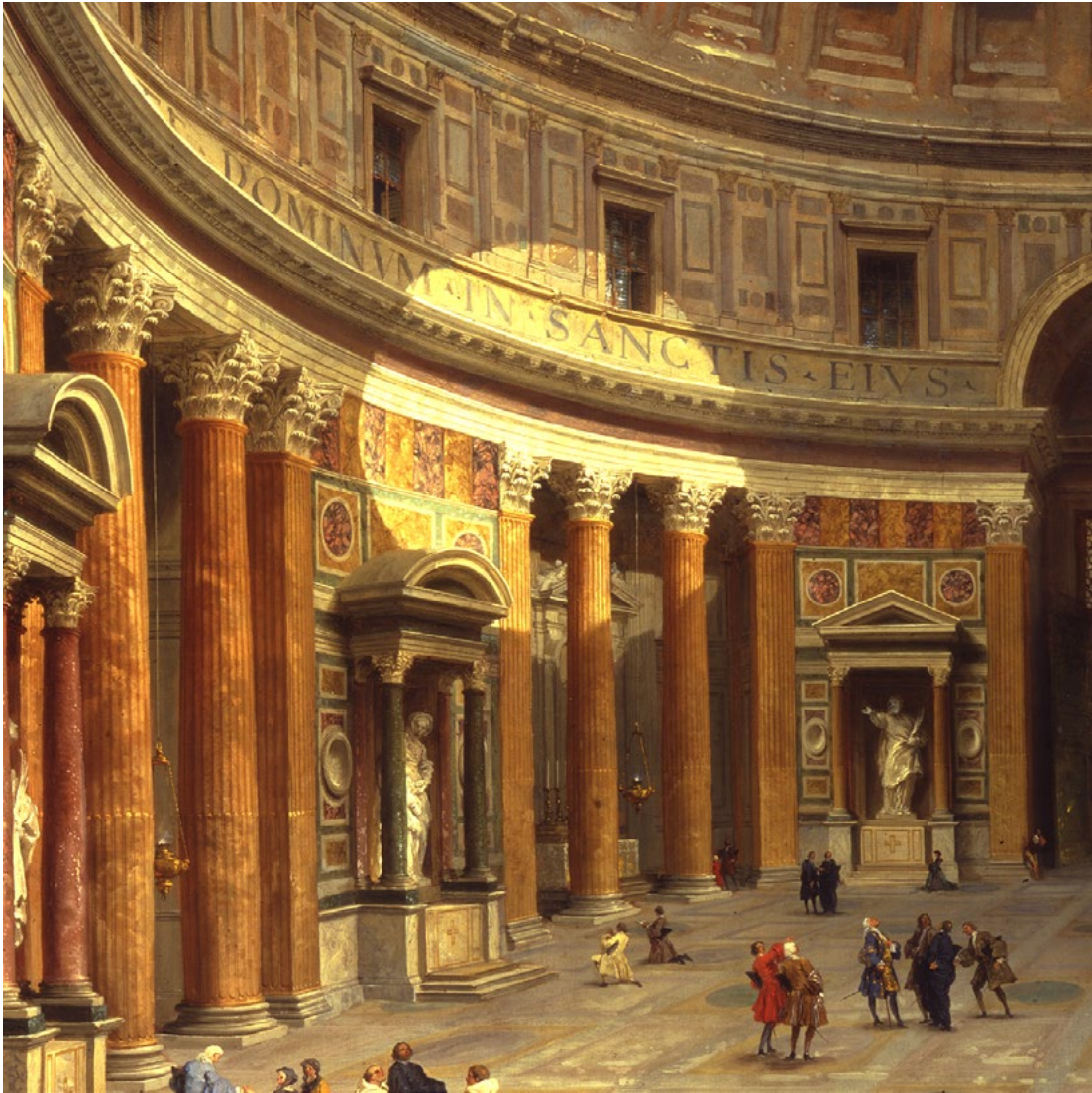
Figure 13. Giovanni Paolo Panini, Interior of the Pantheon, Rome, 1734, detail, oil on canvas, 122 x 98 cm. Inscribed «I.P. PANINI Romae 1734» on the column pedestal at right. New York, Asbjorn Lunde Collection (owner).