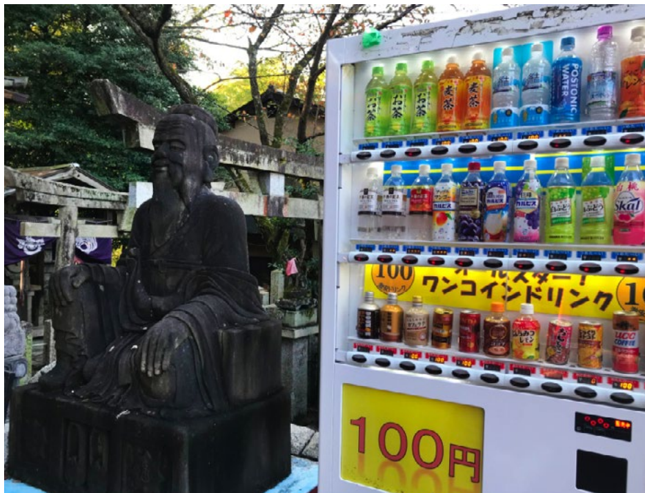
Figura 14. Osaka, distributore di bibite in cimitero (foto C. Polidori, ottobre 2019).