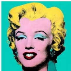
Andy Warhol. Marilyn Monroe. 1962-67 Museum of Modern Art, New York