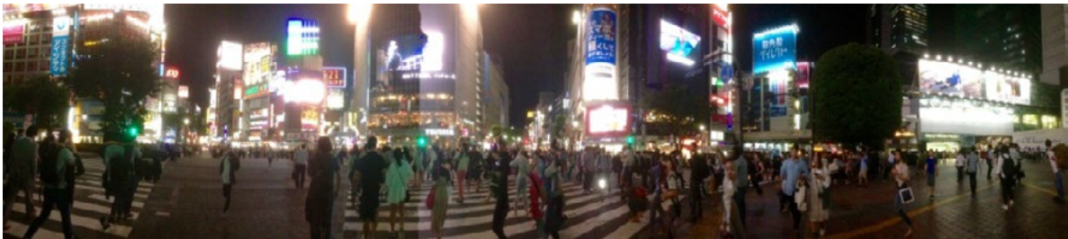
In alto, figure 5-6. Nakagyo-Ku, mercato (foto C. Polidori, novembre 2018); in basso, figura 7. Tokyo, Shibuya Crossing (foto C. Polidori, maggio 2018).