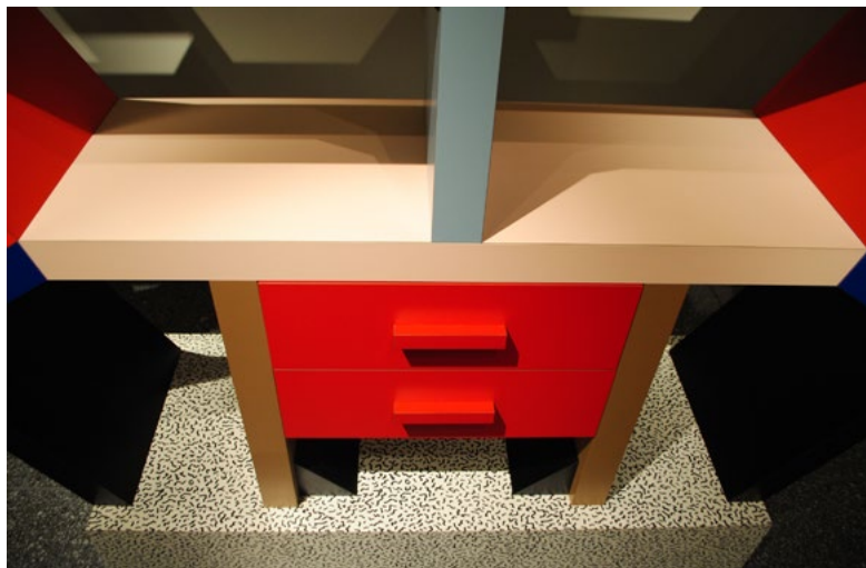
Figura 3. Ettore Sottsass, libreria-totem Carlton per Memphis, dettaglio, 1981, New York, Metropolitan Museum (foto C. Polidori, gennaio 2012).

Figura 2. Cecilia Polidori, Ettore Sottsass qualche annotazione sul designer , Lezione 8, Marzo 2018 Dispensa, 16 Gennaio 2018, http://www.unirc.it/documentazione/materiale_didattico/1463_2018_466_31883.pdf (25 settembre 2019).