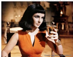
Liz Taylor in Cleopatra, 1963