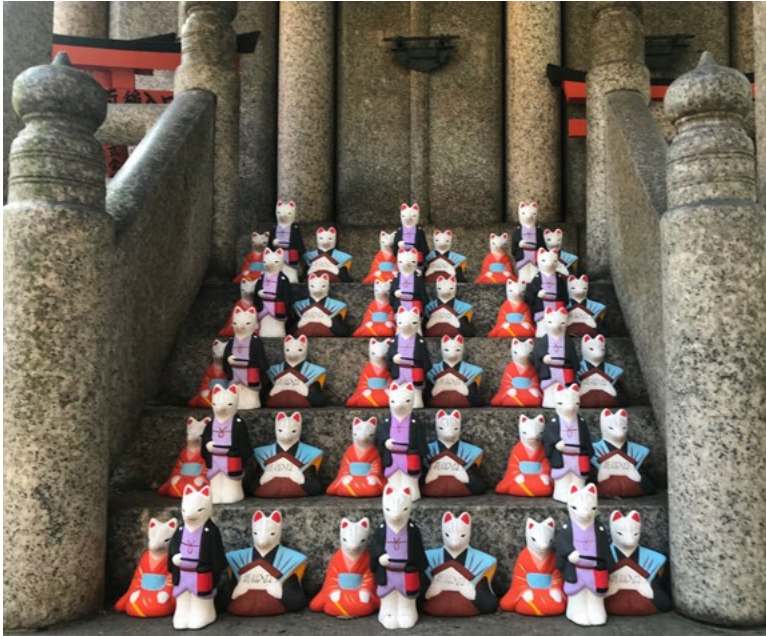
Figura 4. Santuario Fushimi Inari Taisha (Santuario della volpe di Kyoto), Fushimi-Inari-Shrine-Ku, Kyoto-Shi, Fukakusaidoguchicho. La volpe (kitsune) in Giappone è simbolo di mutazione, è magica e molto intelligente (foto C. Polidori, novembre 2018).