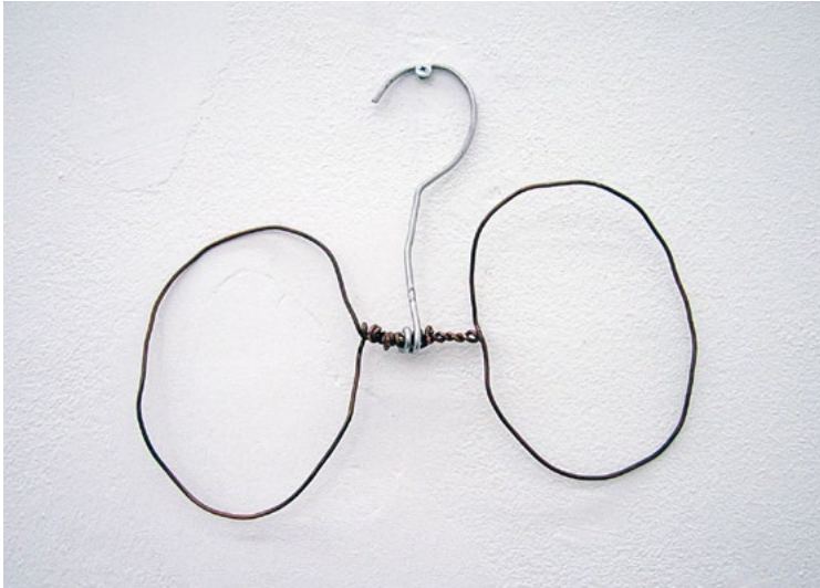
Figura 1. Vassilij Bobrov, Gancio appendi stivali primitivo in rame e alluminio. Regione di Voronež, 1997 (da ARCHIPOV 2007).