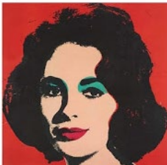
Andy Warhol, Liz, 1965