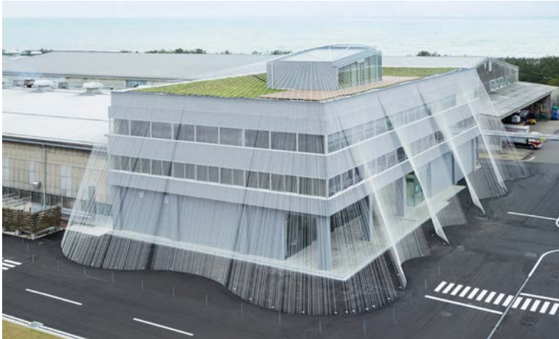
Figura 4. L'edificio della società Komatsu Seiren a Nomi, nella prefettura di Ishikawa, in Giappone, è la prima struttura di adeguamento sismico al mondo realizzata in fibra di carbonio ed è stata progettata dall'architetto giapponese Kengo Kuma, https://o.aolcdn.com/images/dims?quality=85&image_uri=http%3A%2F%2Fo.aolcdn.com%2Fhss%2Fstorage%2Fmidas%2Fba3ea58ffcebf92bc32db0113d45be1%2F203681121%2Fcabkoma-strand-rod.jpg&client=amp-blogs-v2&signature=58fae07d186b20f6743a2fd88abab18d3a824290 (ultimo accesso 12 febbraio 2019).

acciaio resistente al sisma, realizzato in funzione della capacità iniziale dello stabile nello stato di fatto, con l'obiettivo di sostenere le azioni prodotte dal movimento generale dell'insieme architettonico. Tale tecnica può non riguardare l'intero immobile, ma solo parti di esso; dunque la sua incidenza sull'edificio ha una elevata capacità di integrazione con la forma dell'architettura.