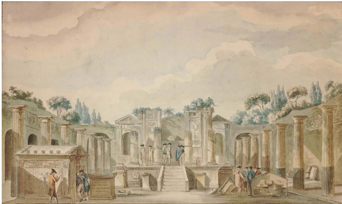
Figura 1. Louis-Jean Desprez, veduta del tempio di Iside a Pompei, replica del disegno esecutivo, penna e inchiostro grigio, acquerello. London, British Museum, inv. 1864.1210.501.