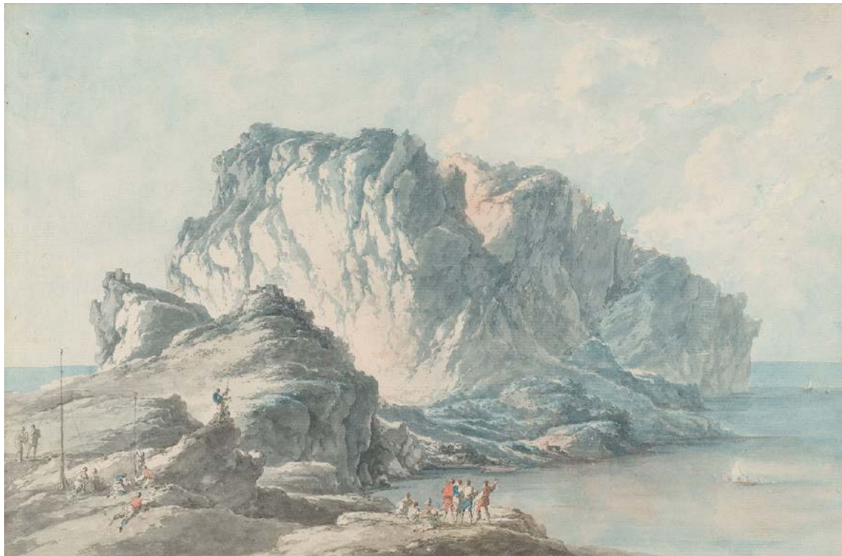
Figura 6. Claude-Louis Châtelet, prima veduta dell'isola di Capri, variante compositiva, penna e inchiostro nero, acquerello. New York, The Pierpont Morgan Library, inv. 1994.2.