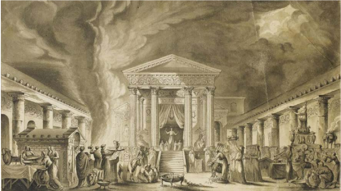
Figura 2. Louis-Jean Desprez, ricostruzione ideale del tempio di Iside a Pompei, disegno esecutivo, penna e inchiostro, acquerello. Già Sotheby's London, vendita 6 luglio 2010, lotto 145.