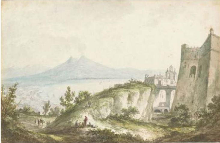
Figura 5. Claude-Louis Châtelet, veduta del golfo di Napoli da Castel Sant'Elmo, disegno esecutivo, penna e inchiostro bruno, acquerello. Birmingham Museum of Art, inv. 1991.263.3.