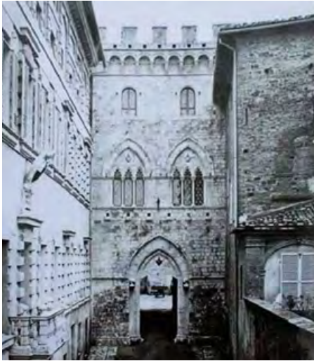
Figura 21. Siena, la facciata del Castellare Salimbeni e lo spazio urbano antistante prima degli interventi di Partini (da BUSCONI 1981).

improntato sul genus , cioè ritornare al principio genetico che ha portato alla creazione di quelle opere. Cioè ritornare a pensare 'geneticamente' con lo spirito in cui avrebbero ragionato, in questi casi, nel Medioevo 19 . A questo portano entrambi gli studi, sia nell'opera di Viollet-le-Duc, sia in quella dei puristi senesi. Rientrare in quello spirito per ricrearlo, ma non per rifarlo con le stesse forme. Il caso, anch'esso abbastanza evidente, si ripete nell'intervento di Partini a piazza Salimbeni a Siena che viene praticamente riprogettata. Nel castellare dei Salimbeni si ripete, come nel cortile di Torre Alfina, la moltiplicazione degli assi di finestre che, nel caso senese, vengono portati da due a sei, aggiungendone quattro completamente nuovi (fig. 22). Nel contiguo palazzo Spannocchi, Partini riproduce il fianco mancante, intervento che provoca le ire della rivista londinese «The Athenaeum» 20 , ripetendovi il prospetto della facciata che si