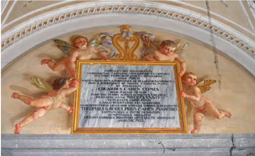
Figura 6. Torre Alfina, castello, iscrizione dipinta al piano terra della galleria che ricorda i passaggi di proprietà del maniero dai Monaldeschi della Cervara, ai Bourbon del Monte di Santa Maria, fino ai lavori architettonici effettuati dal primo marchese Edoardo Cahen (1884) e alle decorazioni pittoriche volute dal figlio Teofilo Rodolfo, 1912 (foto R. Chioveli).