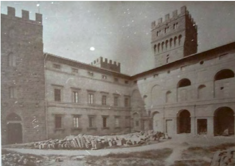
Figura 15. Torre Alfina, il cortile rinascimentale del castello appena concluso l'intervento di demolizione del corpo di fabbrica che lo ingombrava operato da Partini, in una fotografia dei fratelli Alinari (da Fratelli Alinari 1892).