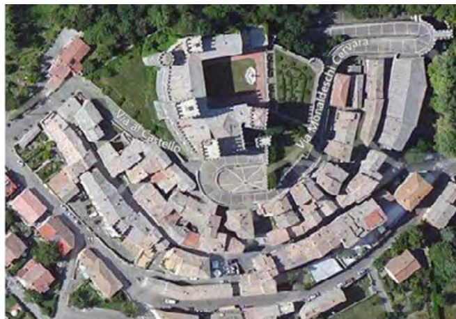
Figure 13 a-b. Confronto fra la pianta di Torre Alfina del catasto gregoriano e la situazione edilizia attuale, da cui emerge come Partini abbia ampliato notevolmente il fabbricato del castello sul lato d'ingresso, aggiungendovi anche una torre, ed abbia invece demolito il volume edilizio che ingombrava il cortile rinascimentale sullo stesso lato (elaborazione S. Pifferi).