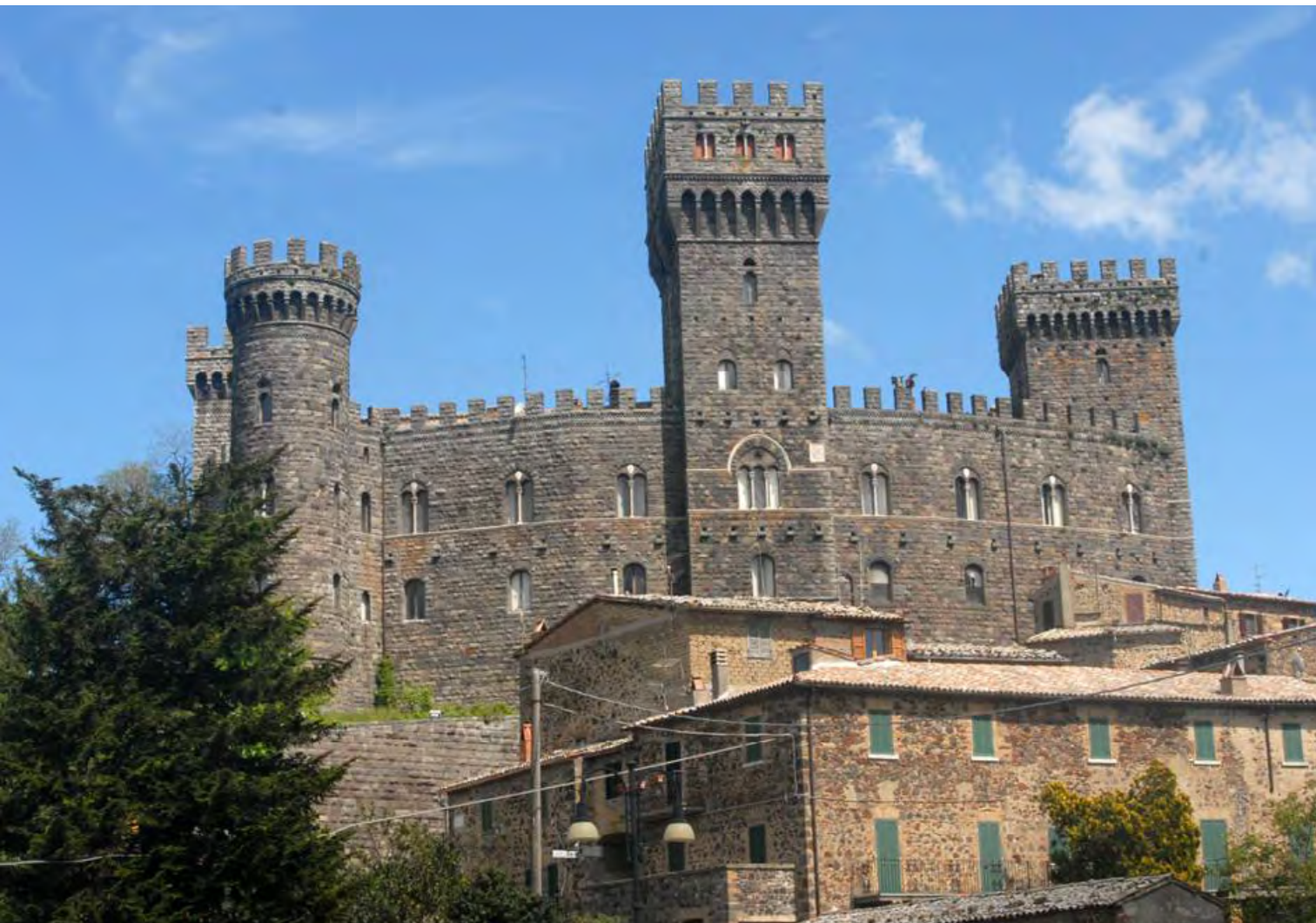
Figura 1. Acquapendente, Viterbo, il fronte principale del castello di Torre Alfina come appare oggi, dopo gli interventi ottocenteschi dell'architetto purista senese Giuseppe Partini.