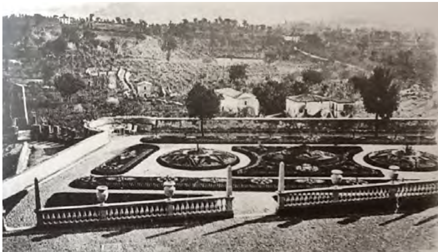
Figura 23. Torre Alfina, il giardino interno agli spalti del castello come appariva in base al progetto dei paesaggisti francesi Henri e Achille Duchêne.