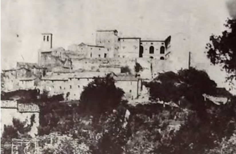
Figura 14. Torre Alfina, il cortile rinascimentale del castello prima degli interventi di Partini, quando erano visibili solo tre assi di finestre.