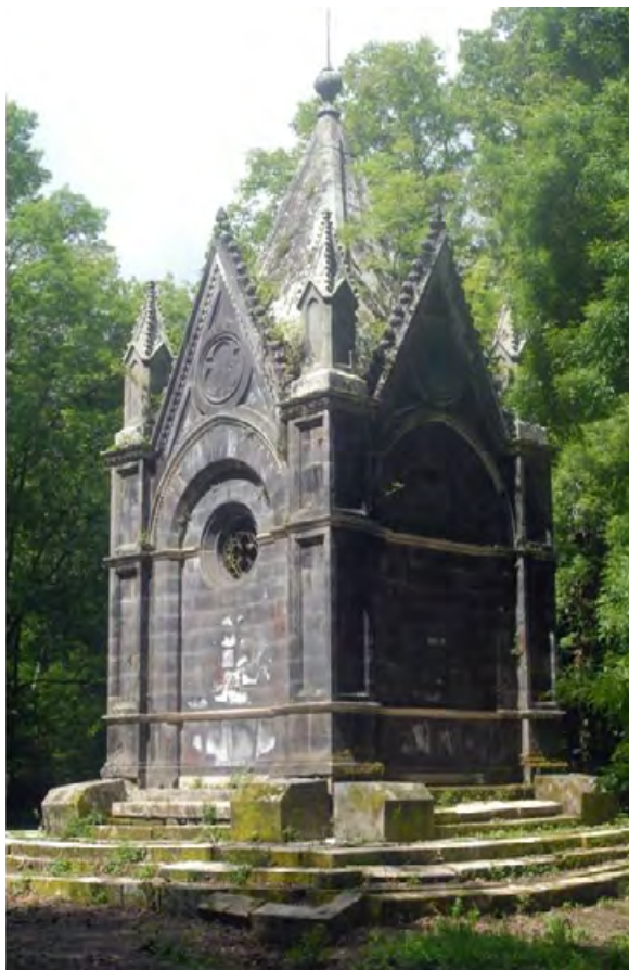
Figure 25 a-b. Torre Alfina, la tomba progettata da Giuseppe Partini per il marchese Edoardo Cahen nel bosco del Sasseto.