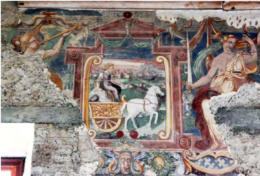
Figura 7. Torre Alfina, castello, affreschi rinascimentali nell'ala settentrionale, non completata, in cui compaiono i simboli araldici dei Monaldeschi della Cervara.