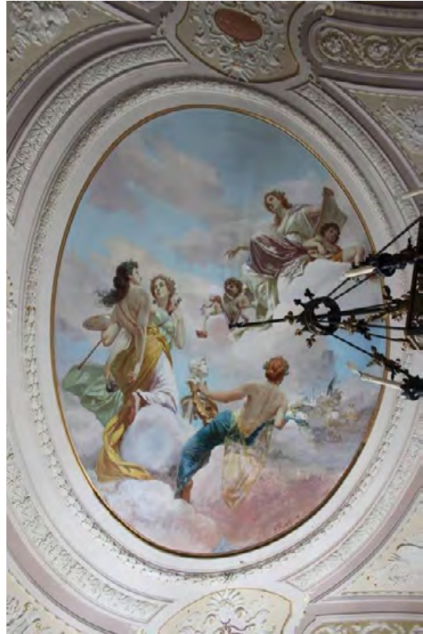
Figure 18 a-b. Torre Alfina, particolari delle decorazioni della galleria al piano terra del castello; nei peducci in stile rinascimentale delle volte compaiono le mezzelune araldiche della famiglia senese dei Piccolomini (foto R. Chiovelli).