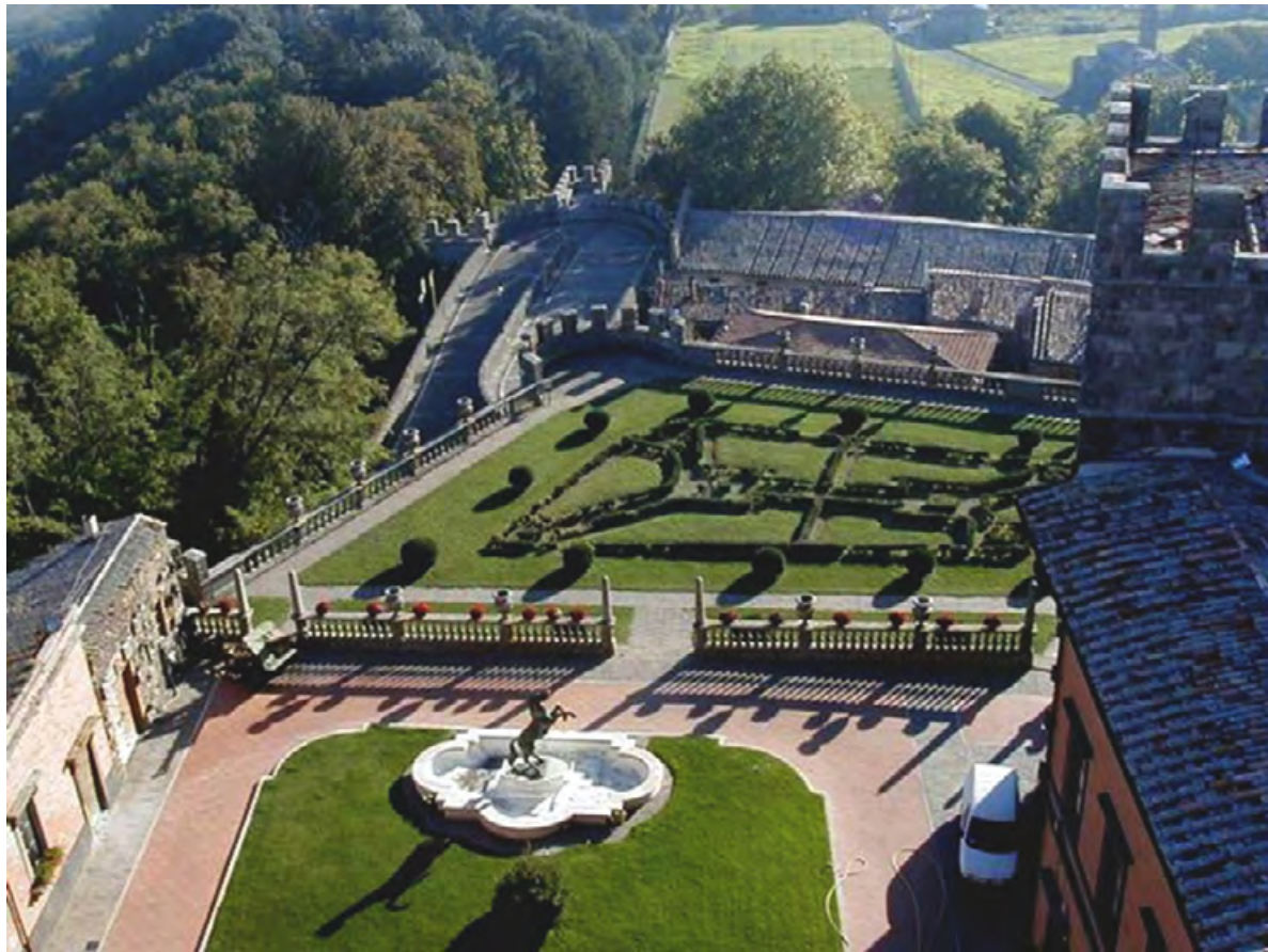
Figura 22. Torre Alfina, veduta odierna del giardino interno agli spalti del castello.