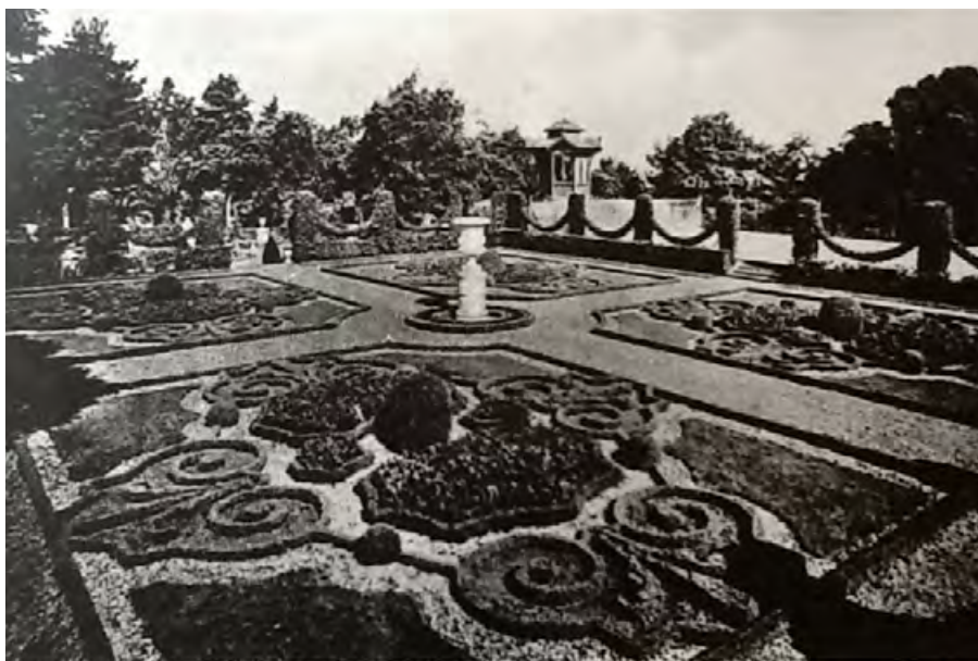
Figura 24. Torre Alfina, i giardini progettati dai paesaggisti Duchêne nel parco ai piedi del castello.