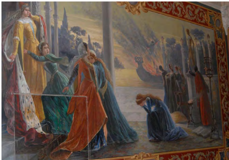
Figura 19. Torre Alfina, raffigurazione dell'opera di Gabriele D'Annunzio Il sogno d'un tramonto d'autunno , musicata da Teofilo Rodolfo Cahen (1903), dipinta nella galleria superiore del castello.