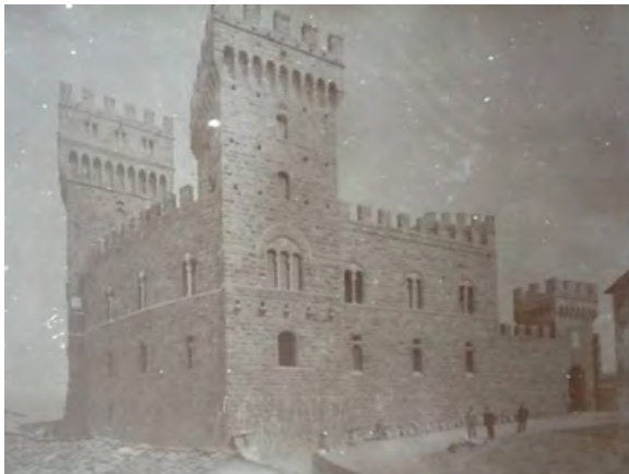
Figura 11. Torre Alfina, l'ala e la torre aggiunte da Partini nel lato d'ingresso del castello in una fotografia dei fratelli Alinari scattata alla fine dei lavori (da Fratelli Alinari 1892).