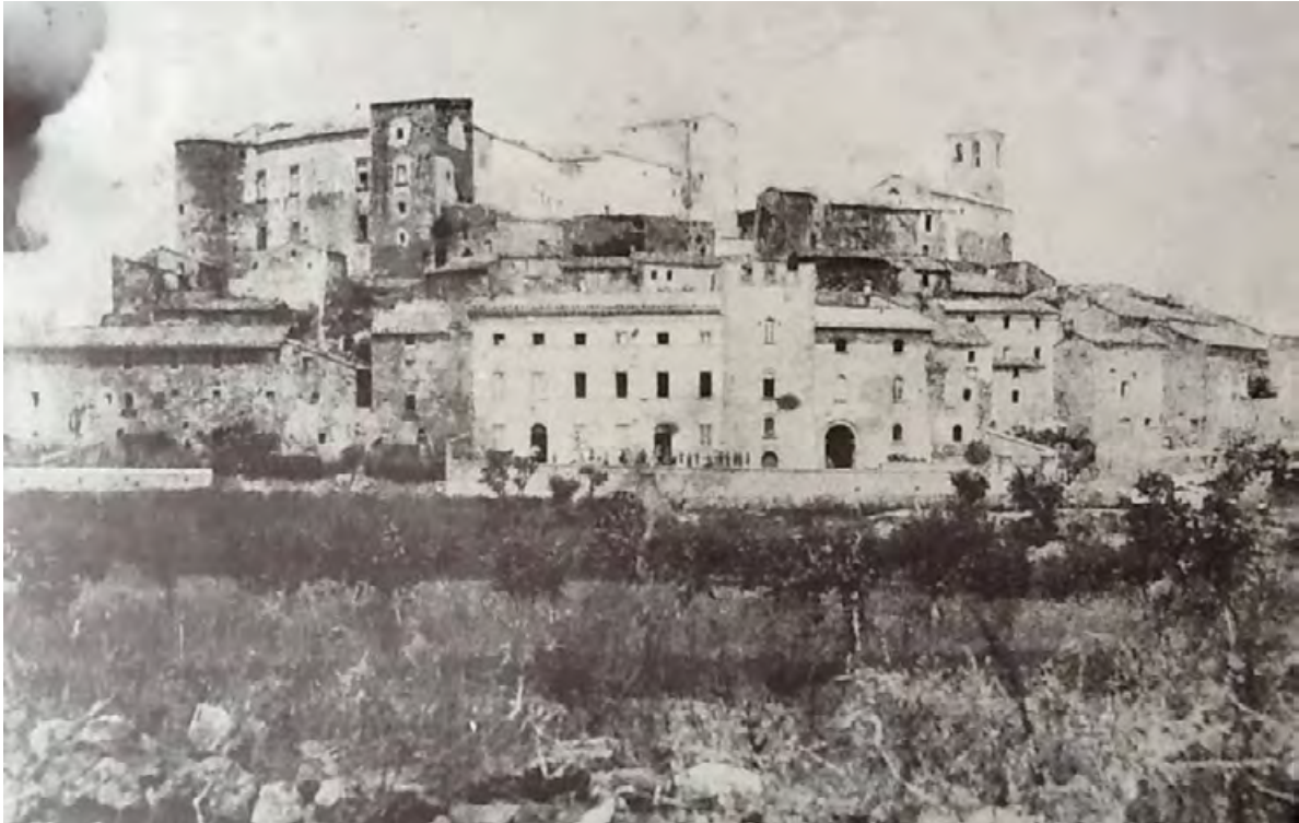
Figura 5. Immagine fotografica degli anni Ottanta dell'Ottocento, al momento dell'acquisto da parte di Edoardo Cahen dai Bourbon del Monte di Santa Maria, da cui è stato tratto il disegno esposto all'interno del maniero.