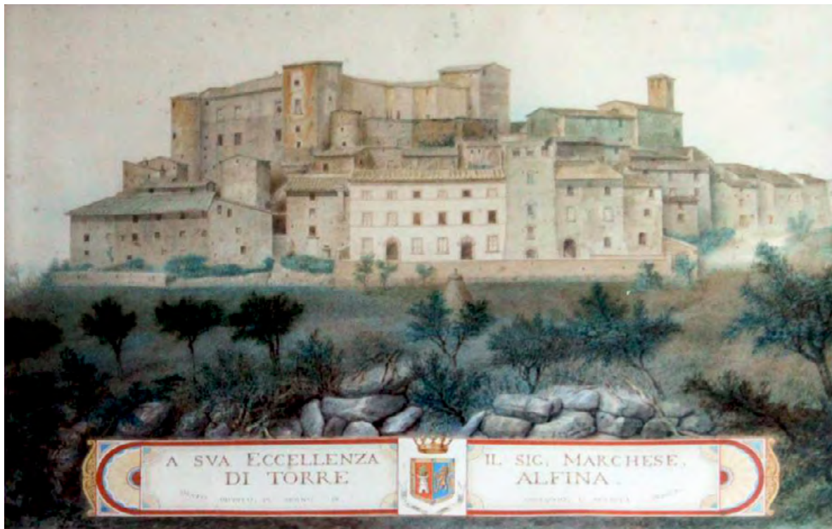
Figura 4. Disegno dedicato al marchese di Torre Alfina ed esposto al piano terra della galleria del castello, che mostra l'abitato e il maniero nel corso dell'Ottocento, anteriormente agli interventi di Partini ed in seguito alle trasformazioni rinascimentali volute da Sforza Monaldeschi della Cervara.