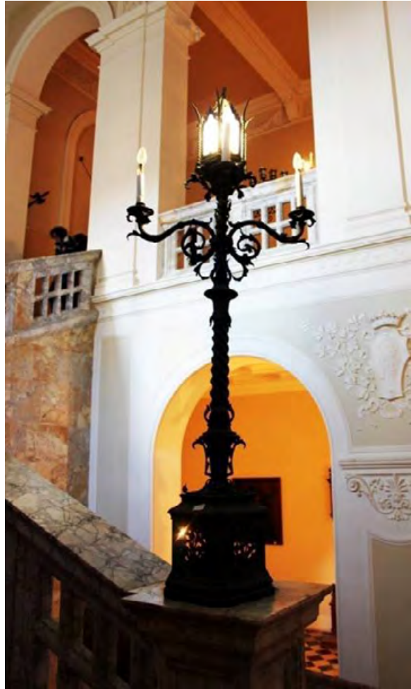
Figure 16 a-b. Torre Alfina, opere in ferro battuto all'esterno del castello e nello scalone monumentale realizzato da Partini.