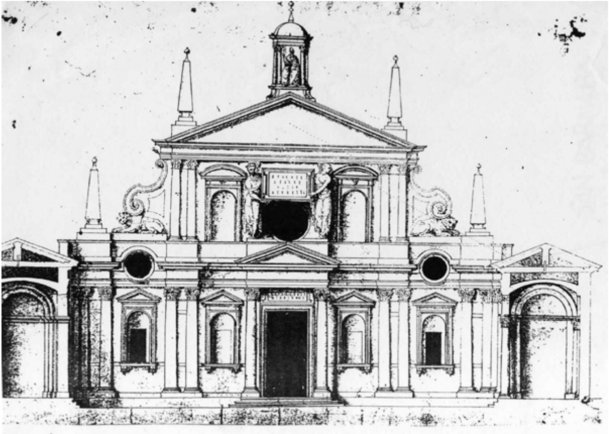
Figura 4. Pellegrino Tibaldi, progetto per la facciata della chiesa di San Celso, 1580c.; ASCMi-BTMi, Raccolta Bianconi, IV, f. 35b.