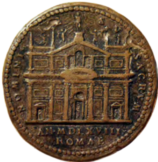
Figura 6. Medaglia di fondazione della facciata della chiesa di Gesù di Roma con il progetto di Jacopo da Vignola, 1568.

la facciata di Saronno rivela ulteriori piccoli debiti: i capitelli ionici della serliana con ghirlanda tra le volute ricordano quelli del Palazzo dei Conservatori 25 , mentre le grandi trabeazioni sporgenti sopra le colonne binate rimandano a molti dei progetti eseguiti ancora per la facciata del Duomo di Milano.