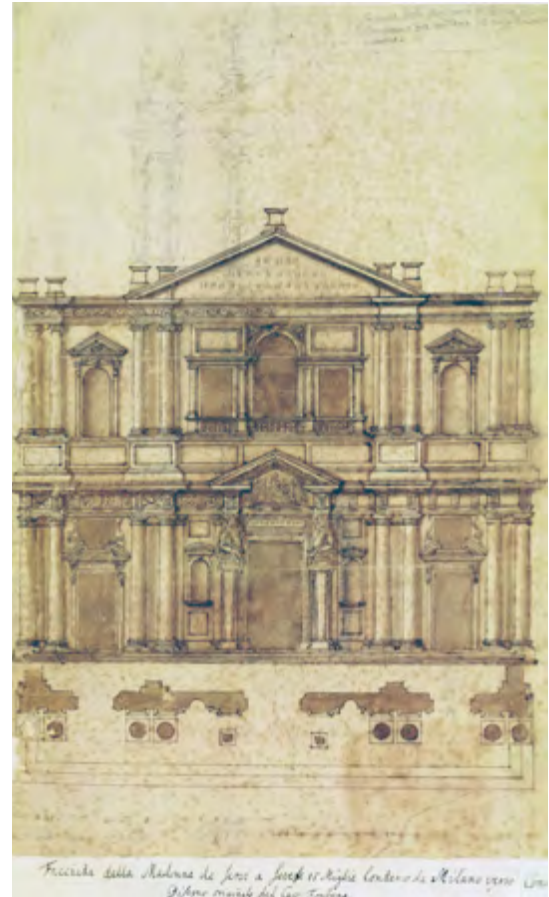
Da sinistra, figura 2. Saronno, Santuario della Beata Vergine dei Miracoli; figura 3. «Facciata della Madonna de' Servi a Sevese 16 miglia lontano da Milano verso Como, disegno originale del cav. Fontana», XVII secolo; Wien, Albertina Graphische Sammlung, AZ Ita Ausser Rom, Saronno, 276 (GATTI PERER 1997).