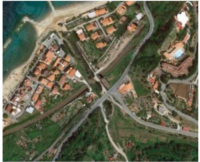
Fig. 1a - Inquadramento del ponte sito in Villa San Giovanni

La parte in c.a. presenta tratti affetti da dilavamento del calcestruzzo, efflorescenze, espulsione del copriferro, riprese di getto, ammaloramenti, questi imputabili ad una non corretta esecuzione dell'opera. La pavimentazione stradale presenta invece uno stato di usura accentuato, con fessurazioni longitudinali, ondulazioni e buche.