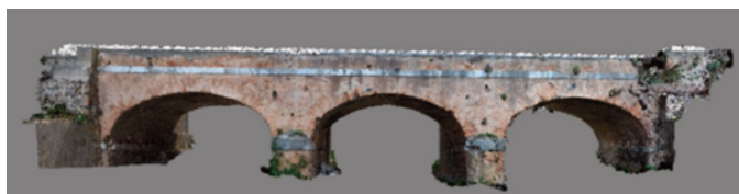
Fig. 4 - Texture del ponte di Villa San Giovanni rilievo da drone