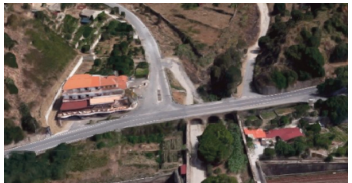
Fig. 1b - Inquadramento del ponte sito in Villa San Giovanni