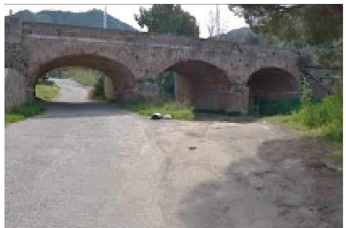
Fig. 2 - Particolare del ponte di Villa San Giovanni