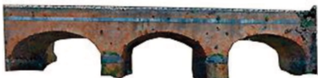
Fig. 8 - Modello 3D restituito da Laser scanner

Per la scansione dell'opera è stato utilizzato un laser scanner terrestre Riegl LMS-Z420i. Il rilievo si è strutturato con la scelta delle posizioni dello strumento, il suo set-up, la sua calibrazione. Segue l'acquisizione dei dati e la fase di elaborazione dei dati con la registrazione delle nuvole di punti, la filtrazione, la pulizia dei dati, la modellazione e la creazione della mesh tridimensionale (vedi Fig. 8).