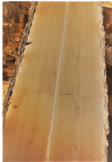
Fig. 6 - Cambio cromatico per far risaltare le difettosità all'analisi visiva

In relazione alle caratteristiche superficiali della pavimentazione è facile osservare come l'esplorazione del modello 3D restituito (previa applicazione di un filtro colore per meglio evidenziare le variazioni cromatiche) permette, anche attraverso la semplice analisi visiva, di individuare le macro lesioni e l'assenza di segnaletica orizzontale e verticale, a secondo della qualità della camera installata e quindi alla sua risoluzione (vedi Fig. 6).