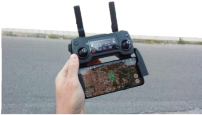
Fig. 3b - Screen dello schermo della ground station con piano di volo