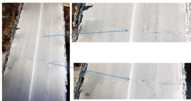
Fig. 5 - Texture del ponte di Villa San Giovanni rilievo da drone

Per un'individuazione degli ammaloramenti superficiali il modello 3D puo' essere filtrato e segmentato, attraverso l'utilizzo di un semplice algoritmo automatico di fotointerpretazione, (utilizzando dei filtri colore che permettono di segmentare pixel per pixel l'immagine in funzione delle variazioni cromatiche presenti nell'immagine) che permette di evidenziare zone dell'asfalto con colorazioni differenti (difettosità macro o buche) e quindi segmentare la zona (vedi Fig. 7).