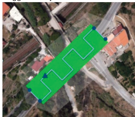
Fig. 3a - Screen dello schermo della ground station con piano di volo

La possibilità del controllo in tempo reale del drone attraverso una ground station ha permesso di avere riprese dettagliate e precise delle opere indagate, monitorando la posizione, la quota e lo stato del dispositivo (Vedi Figg. 3a, 3b).