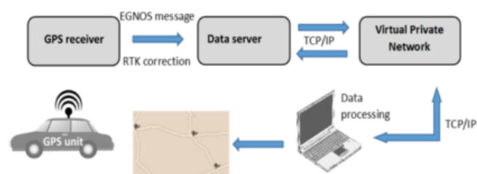
Fig. 1 - Schema operativo dell'architettura proposta.

Brevemente, un algoritmo map-matching associa la posizione identificata dal sensore a coordinate sulla rete stradale, attraverso il confronto tra la traiettoria del veicolo e i percorsi disponibili sulla mappa digitale.