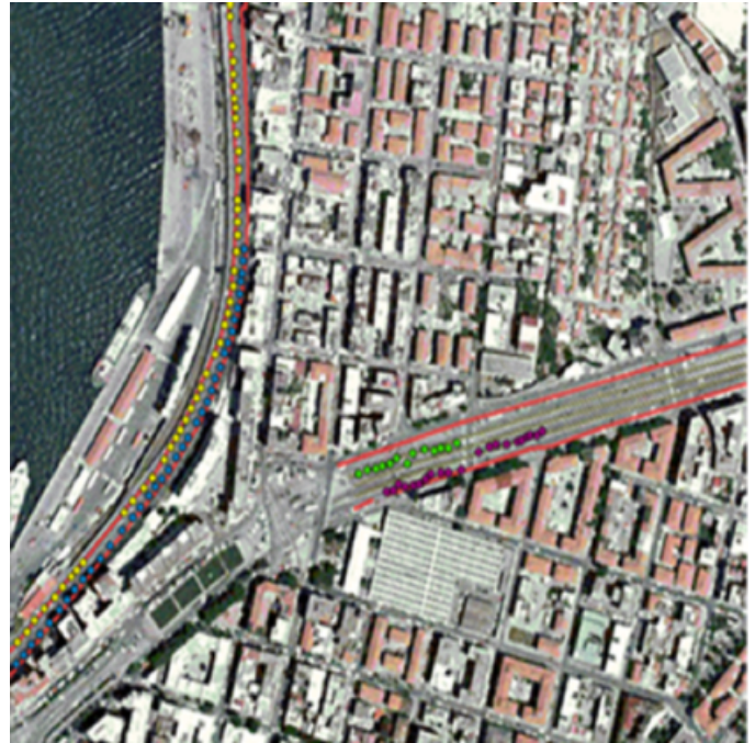
Fig. 2 - Punti riprodotti tramite EGNOS (sulla destra) e RTK (sulla sinistra).

Inoltre, i dati sono stati rappresentati utilizzando una funzione GIS che localizza i punti la cui distanza dalla traiettoria ideale (mezzzeria della corsia) è maggiore di un valore soglia prefissato.